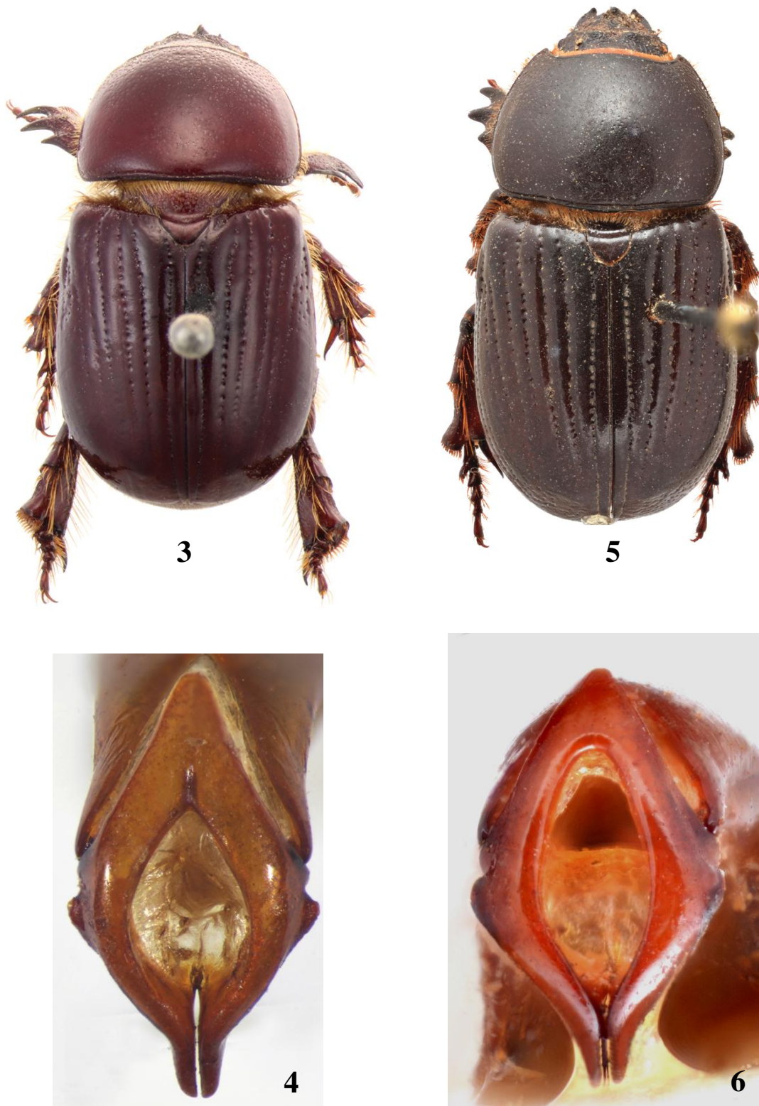
Fig. 3-6 : habitus (vue dorsale) et paramères (vue caudale) de Coléoptères Dynastidae : 3-4, Archophileurus fodiens (Kolbe, 1910), holotype. – 5-6, Oxylygyrus larssoni Endrödi, 1969, paratype..