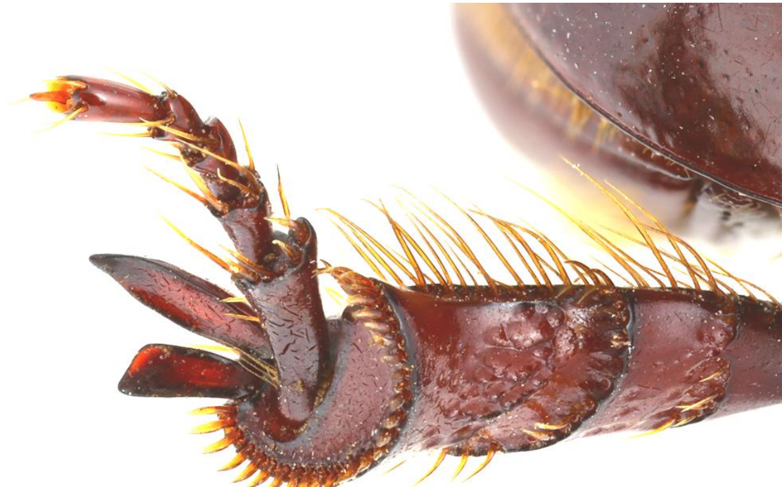
Fig. 2 : Oxylygyrus larssoni Endrödi, 1969, apex du tibia postérieur droit.

Etant établi l'appartenance à la tribu des Phileurini, il reste à définir dans quel genre doit être placée l'espèce. Les différentes clés disponibles pour l'Amérique du Sud (Endrödi, 1977 ; Dupuis, 2020) donnent des résultats comparables : la présence de mandibules à marges externes simples, l'apex des tibias postérieurs tronqué c'est-à-dire sans épines saillantes (Fig. 2) ainsi que la présence de deux tubercules sur le front, permettent sans ambiguïté de ranger l'espèce dans le genre Archophileurus Kolbe, 1910, genre largement représenté en Amérique du Sud et dont on trouve plusieurs espèces en Argentine.