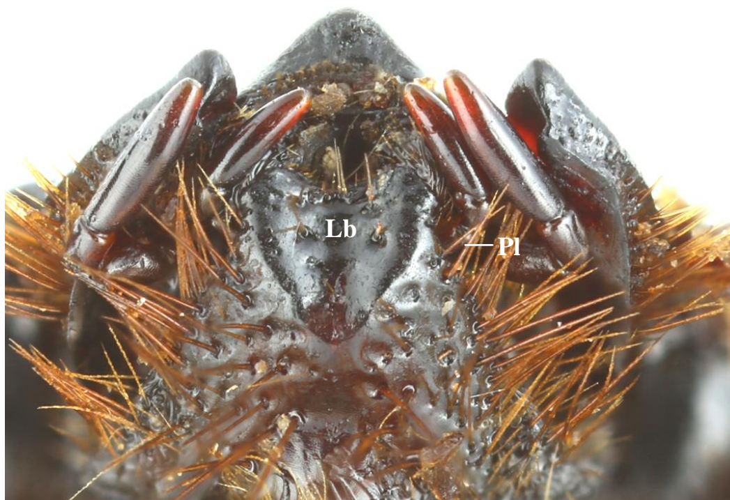
Fig. 1 : Oxylygyrus larssoni Endrödi, 1969, pièces buccales en vue ventrale (Lb : labium ; Pl : article basal du palpe labial).

Ainsi qu'il est admis par l'ensemble des auteurs (Endrödi, 1985 ; Ratcliffe & Cave 2015, 2017 ; Dupuis, 2020), la tribu des Phileurini est caractérisée par une particularité des pièces buccales que l'on ne retrouve dans aucune autre tribu des Dynastidae : le labium est fortement dilaté et il recouvre partiellement ou totalement la base des palpes labiaux, en particulier l'article basal qui est selon les espèces partiellement ou totalement masqué par le labium. L'examen du type d' Oxylygyrus larssoni , et de plusieurs autres spécimens comparables, montre clairement que c'est également le cas pour cette espèce : les marges externes du labium, largement arrondies, masque partiellement l'article basal des palpes labiaux (Fig. 1) qu'il est impossible d'observer en totalité. En conséquence, l'espèce nommée larssoni par Endrödi doit être rangée dans la tribu des Phileurini et par voie de conséquence ne peut pas appartenir au genre Oxylygyrus Arrow, 1908.